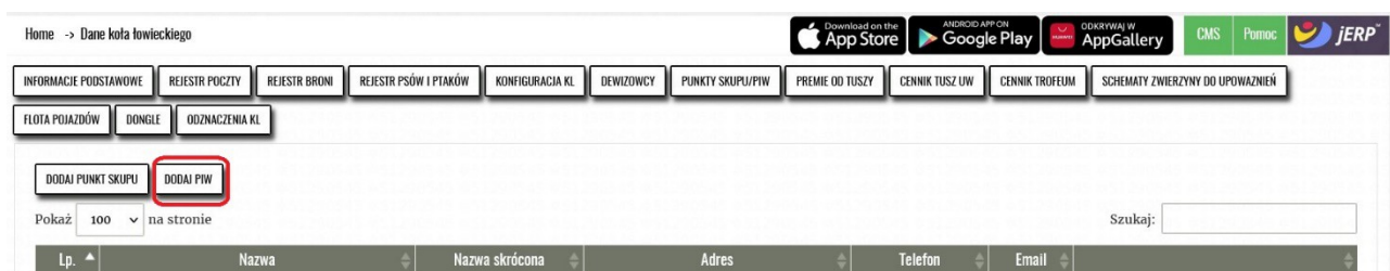
Rys. 2 Dodawanie PIW

Dla umożliwienia myśliwym automatycznego wysyłania informacji o pozyskanych dzikach wysyłanych do ZIPOD, Łowczy Koła należy Koło Łowieckie wybrać zakładkę PUNKTY SKUPU/PIW (rys.1)